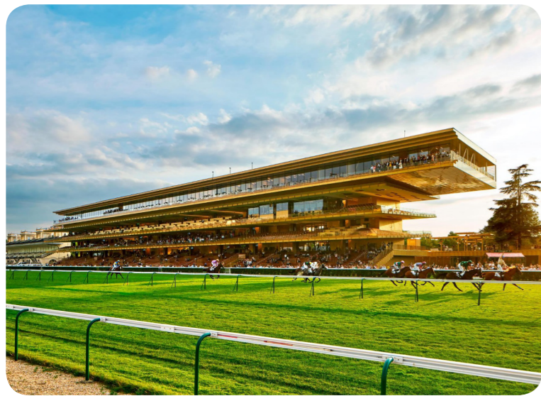
内容均经谨慎处理, 倘有错误, 乃非资料提供者意愿, 若究后果, 恕不受理。

赛事预览: 南方女孩 上阵此赛程有机会雄风再现。野木 评分极佳, 今乃此场合大热门之一。巴尔巴丁 挑战此赛程有望拼入榜内。大家 转战此场合可带来惊喜。